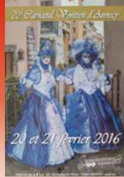
2016 : 20 ème édition