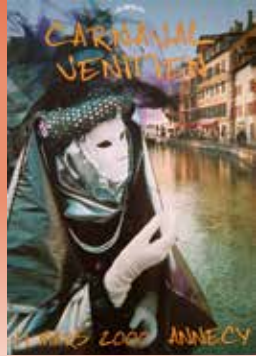
2000 : 1 ère édition