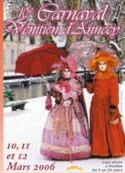
2006 : 10 ème édition